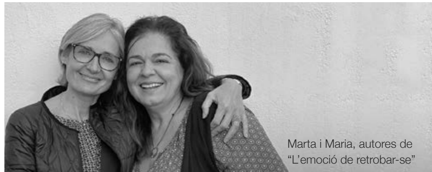
Marta i Maria, autores de "L'emoció de retrobar-se"

Gràcies a tots i totes ara ens hem tornat a veure i hem recuperat la vida en comú, des de la seva vessant més propera.