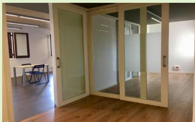
A sobre d'aquestes línies, algunes de les estàncies del nou local

El Telèfon segueix amb la seva expansió i tant és així, que a partir del mes de desembre comptarà també amb un espai exclusiu i nou per a formació . Formacions de tota mena i per a tota classe de públic. Escoles, empreses, particulars... Aquest nou espai, a banda de ser un lloc d'intercanvi de coneixements, està pensat perquè sigui una sala polivalent amb múltiples funcions que s'adaptaran a les necessitats.