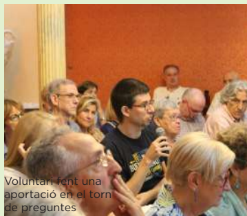
Voluntari fent una aportació en el torn de preguntes

Tant el 13 de juliol com el 28 de setembre els voluntaris i les voluntàries del Telèfon varen reunir-se per celebrar unes jornades de treball conjunt per tal de millorar i posar en comú la tasca de l'últim any .